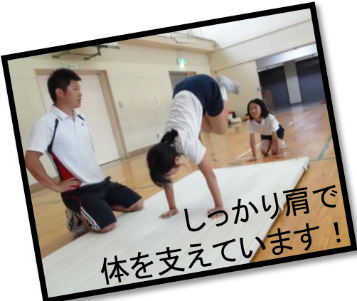
しっかり肩で 体を支えています!