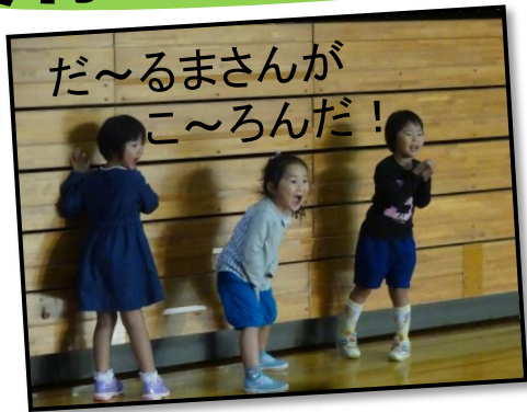
だ〜るまさんが こ〜ろんだ!