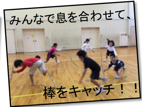
みんなで息を合わせて、