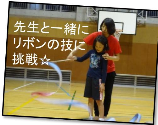
先生と一緒に リボンの技に 挑戦☆